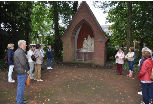
Kreuzweg 1. Station, Jesus wird zum Tod verurteilt

Ab 7:30 Uhr wurden die 46 Teilnehmende in den einzelnen Orten abgeholt. Rechtzeitig zur Pilgermesse erreichten wir Kevelaer. Nach dem Gottesdienst besuchten wir die Gnadenkapelle, wo Gelegenheit zur Anbetung war.