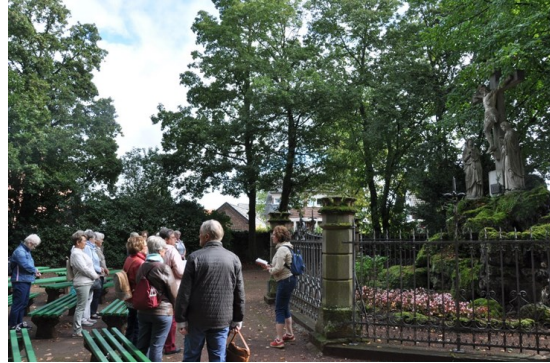
Kreuzweg 12. Station, Jesus stirbt am Kreuz

großen Kreuzweg. Herzlichen Dank für die Gebete und Auslegungen. Nach dem Mittagessen war Freizeit, die