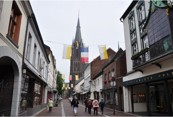
Fußweg zur Basilika

Am 13. September 2023 startete die Buswallfahrt mit den Teilnehmenden aus dem Altdekanat Aldenhoven singend und betend nach Kevelaer.