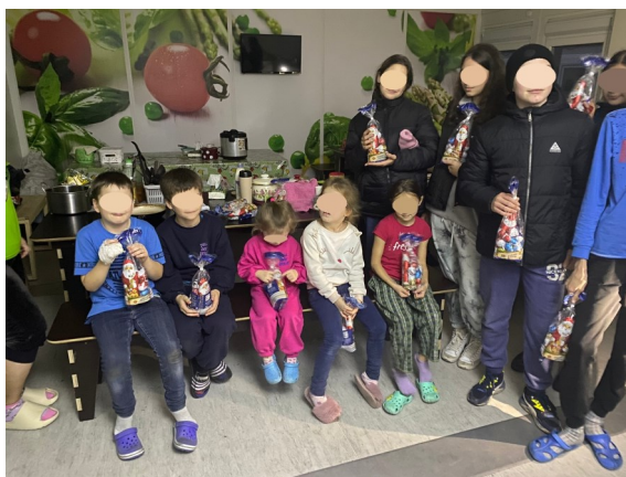
Container Camp in Irpin