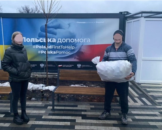
Container Camp in Irpin

Hier ein paar Foto-Impressionen aus der Ukraine: