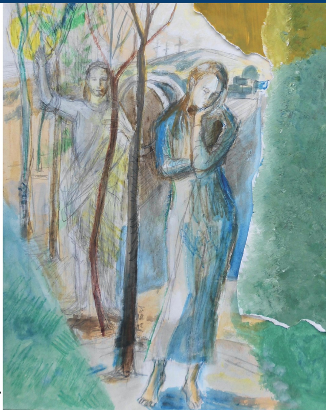
Grafik: Pia Foierl

Liebe ist anders – ein Aufbruch, befreiend, von Vertrauen getragen